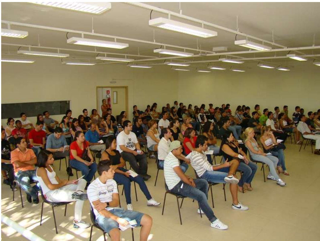
Apresentação da GABRIEL para os alunos calouros da FATEC Indaiatuba