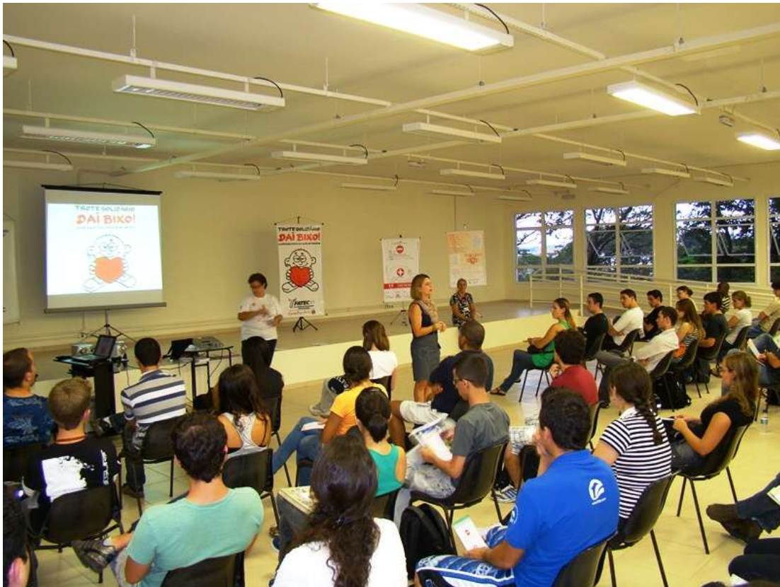
Apresentação da GABRIEL para os alunos calouros da FATEC Indaiatuba