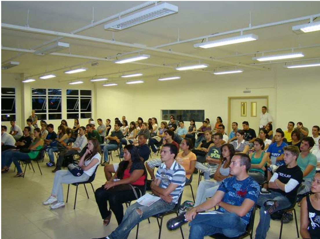
Apresentação da GABRIEL para os alunos calouros da FATEC Indaiatuba