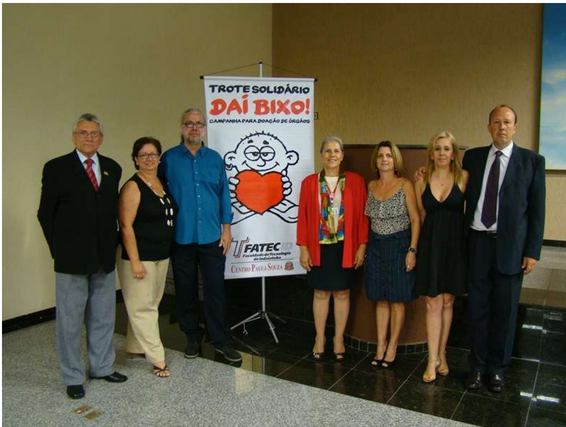
Da esquerda para a direita: