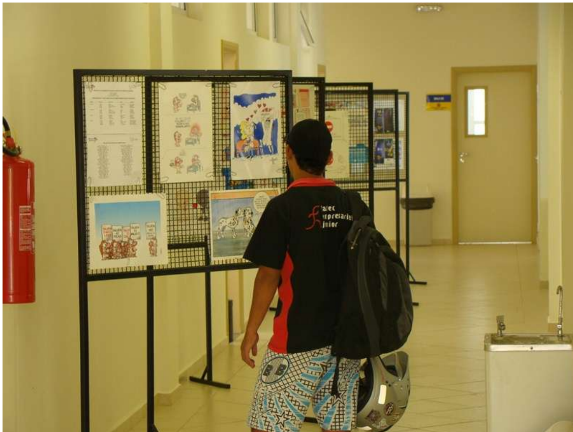
Mostra do 1º Salão Nacional de Humor sobre Doação de Órgãos dentro das instalações da FATEC